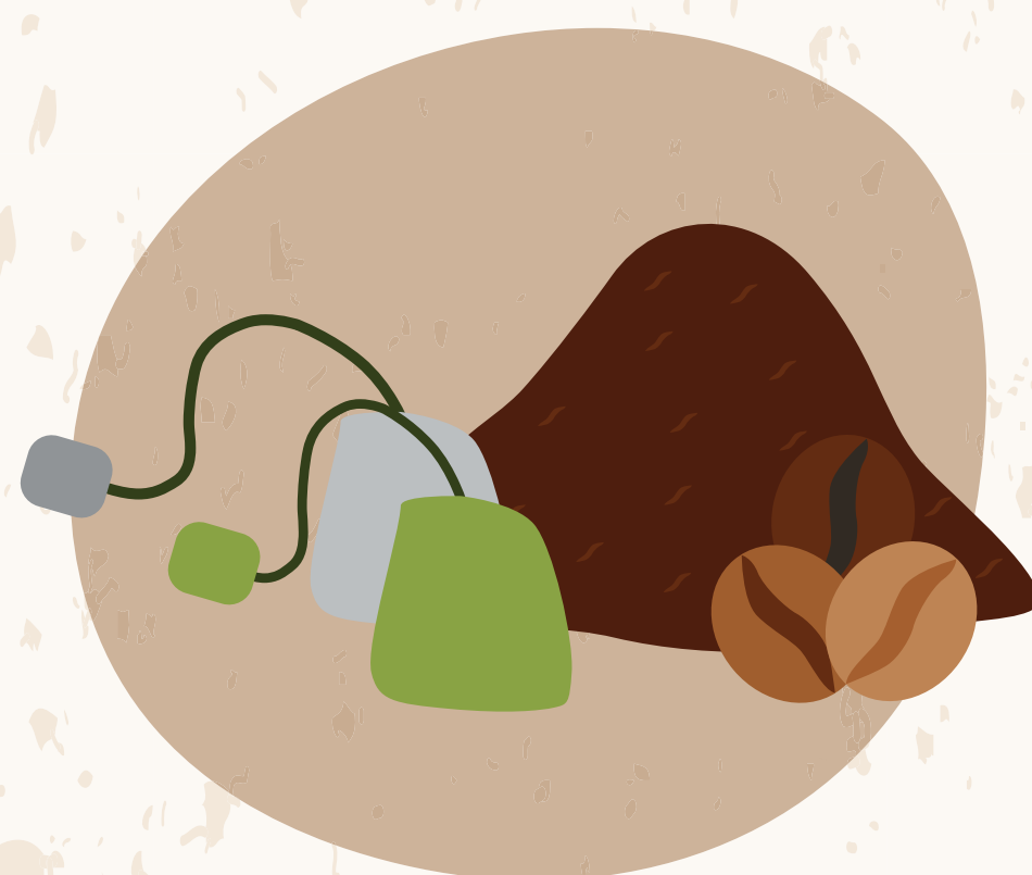
POSOS DE CAFÉ E INFUSIONES