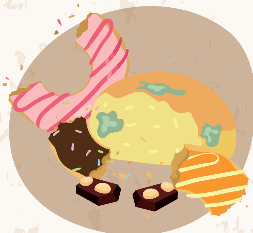
ALTRES RESTES DE MENJAR