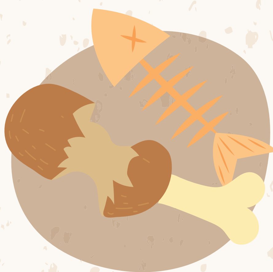
RESIDUOS DE CARNE Y PESCADO