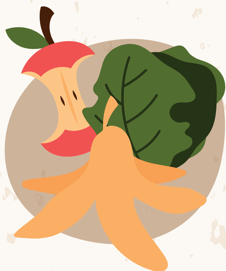
RESTOS DE FRUTA Y VERDURA