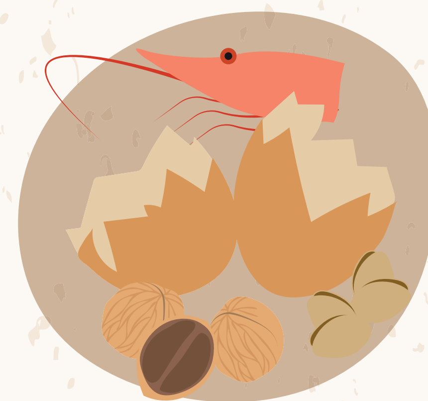
CORFES D'OU, DE MARISC I DE FRUITA SECA