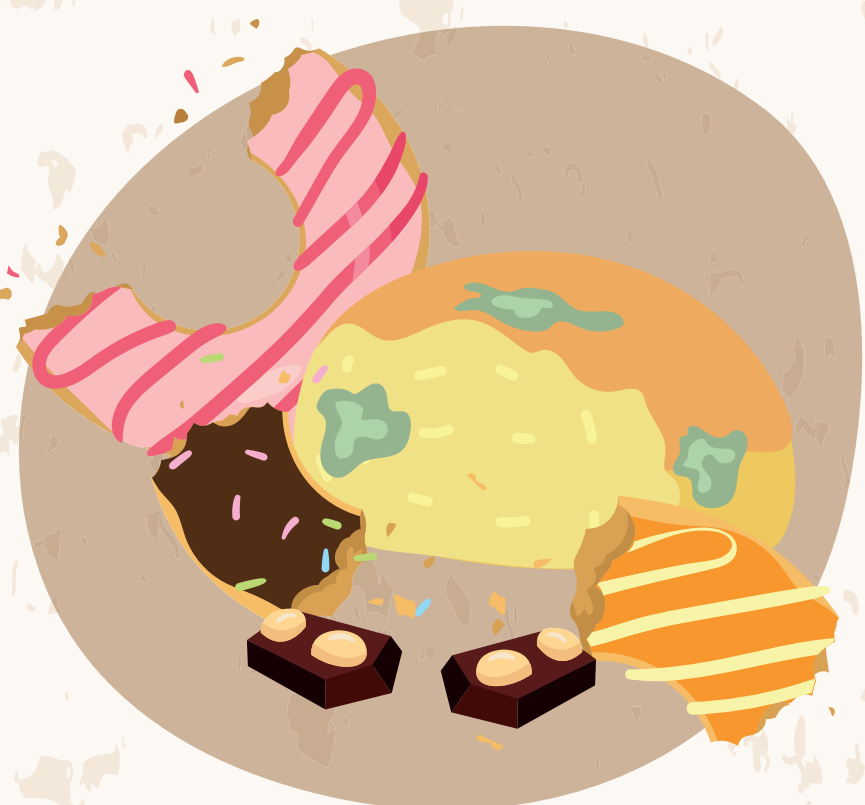
OTROS RESTOS DE COMIDA