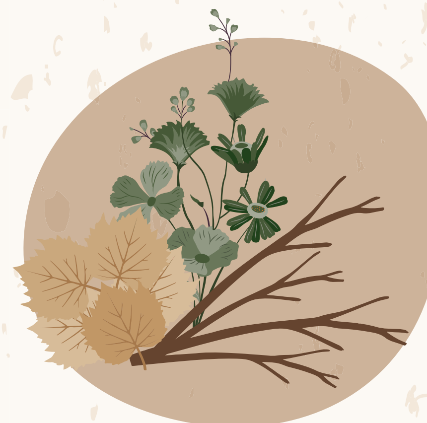
XICOTETES RESTES DE JARDINERIA DOMÈSTICA